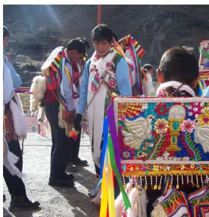
Danzatori -Festival de Qolloritty (Ocongate)

Come possiamo vivere bene? Come possiamo affrontare le nostre paure? Come possiamo gestire lo stress della nostra vita? Per dare una risposta a queste domande dobbiamo considerare la nascita e la morte che sono tra le domande fondamentali, i grandi misteri della nostra vita. Durante l'incontro verranno trattati questi temi visti dal punto di vista andino svolgendo una serie di pratiche utili a risolvere le grandi paure che ci attanagliano e che a volte ci impediscono di vivere in maniera armonica le nostre relazioni interpersonali.