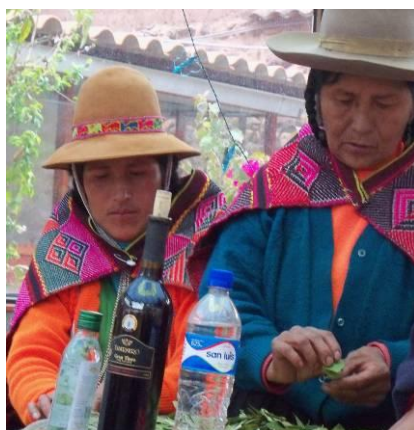
Paqa (sacerdotesse) Comunità Q'ero preparando un rituale